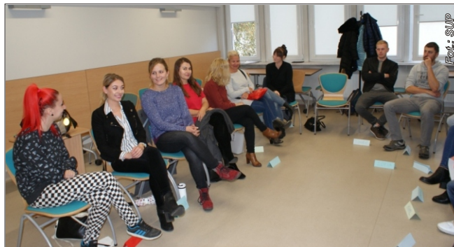
Uczestnicy warsztatów w ramach Tygodnia Przedsiębiorczości

W tegorocznej edycji uczestnikami były osoby bezrobotne zarejestrowane w Sądeckim Urzędzie Pracy, które wyraziły chęć założenia własnej działalności gospodarczej. – Zaproszeni goście, służący merytoryczną wiedzą, to specjaliści związani