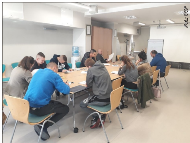
Uczestnicy warsztatów w ramach Ogólnopolskiego Tygodnia Kariery

Ponadto poruszano tematykę umiejętnego budowania marki osobistej, która jest przydatną zdolnością np. podczas rozmowy kwalifikacyjnej. Były to spotkania informacyjne dotyczące usług połączone z warsztatami związanymi z pisaniem listu motywacyjnego.