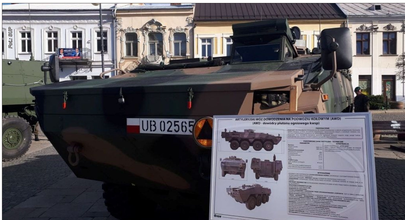
Artyleryjski wóz dowodzenia na podwoziu kołowym

Służby mundurowe cechuje prestiż i szacunek społeczny. Wielu z nas będąc dzieckiem zwracało uwagę na zawody szczególnego, społecznego zaufania. Doskonale pamiętamy zabawy w policjanta, wyjazdy na akcje wymyślonymi samochodami straży pożarnej, pojedynki żołnierskie na froncie w piaskownicy. Wszyscy wiążemy pozytywne emocje z tymi zawodami – gwarantują przecież stabilizację i bezpieczeństwo. Wykonywanie zawodu policjanta, strażaka czy wojskowego to marzenie niemal każdego dziecka. Część osób realizuje owe marzenia w dorosłym życiu w formie zatrudnienia, część w formie pasji.