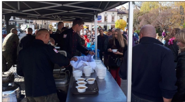
Wojskowa grochówka cieszyła się ogromną popularnością

Zawody szczególnego zaufania – policjant, strażak czy wojskowy – z pewnością wymagają zaangażowania, kondycji, odpowiednich warunków. Dodatkowo spełniają bardzo ważną rolę – dają poczucie bezpieczeństwa i stabilizacji w społeczeństwie, w zamian oferując pracę stabilną i dobrze płatną. Planując swoją przyszłość lub myśląc o zmianie pracy, warto zwrócić na nie szczególną uwagę.