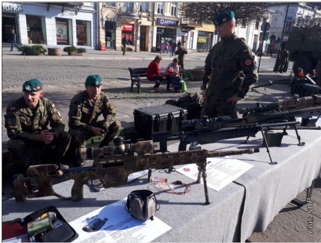
Stanowisko z karabinami, snajperkami, granatnikami

gada była podporządkowania dowódcy 1 Dywizji Zmechanizowanej.