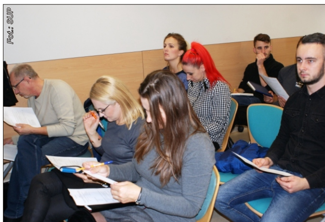
Uczestnicy warsztatów w ramach Tygodnia Przedsiębiorczości

W ramach projektu zorganizowano grupową informację zawodową pn. “Urzędowe drogowskazy na mapie przedsiębiorcy” oraz przeprowadzono warsztaty pn. “Analiza predyspozycji przedsiębiorczych. Planowanie własnej działalności gospodarczej” . Zajęcia odbyły się w siedzibie Sądeckiego Urzędu Pracy w Nowym Sączu przy ul. Węgierskiej 146. Jednym