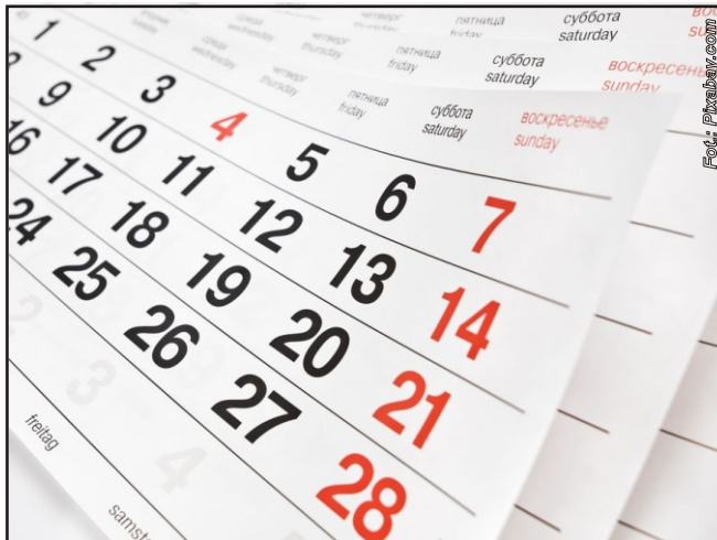
Pracownicy i pracodawcy powinni zwracać szczególną uwagę na terminy

Kolejne ważne zmiany tyczą się pracowników zatrudnionych tymczasowo. Na koniec listopada przypada termin zakończenia 18-miesięcznego limitu skierowania pracownika tymczasowego do jednego pracodawcy. Właściciel firmy łamiący przepisy musi liczyć się z wysokimi karami finansowymi w wysokości do 30 tysięcy złotych.