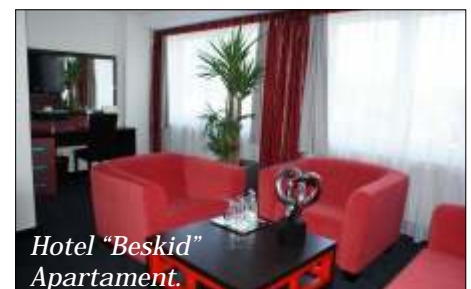
Hotel "Beskid" Apartament.