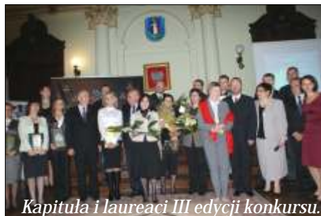
Kapituła i laureaci III edycji konkursu.