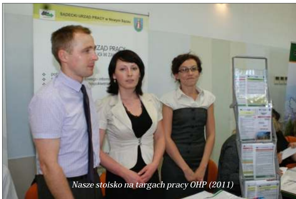
Nasze stoisko na targach pracy OHP (2011)