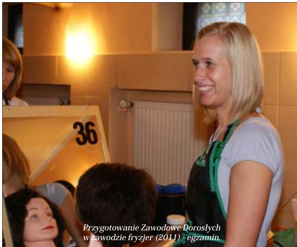
Przygotowanie Zawodowe Dorosłych w zawodzie fryzjer (2011) - egzamin.