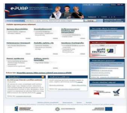
Strona platformy ePUAP