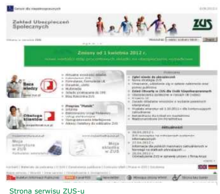
Strona serwisu ZUS-u

„Liczymy na to, że dostęp do nowych, elektronicznych usług w znaczący sposób ograniczy konieczność osobistych wizyt naszych klientów w placówkach ZUS-u”