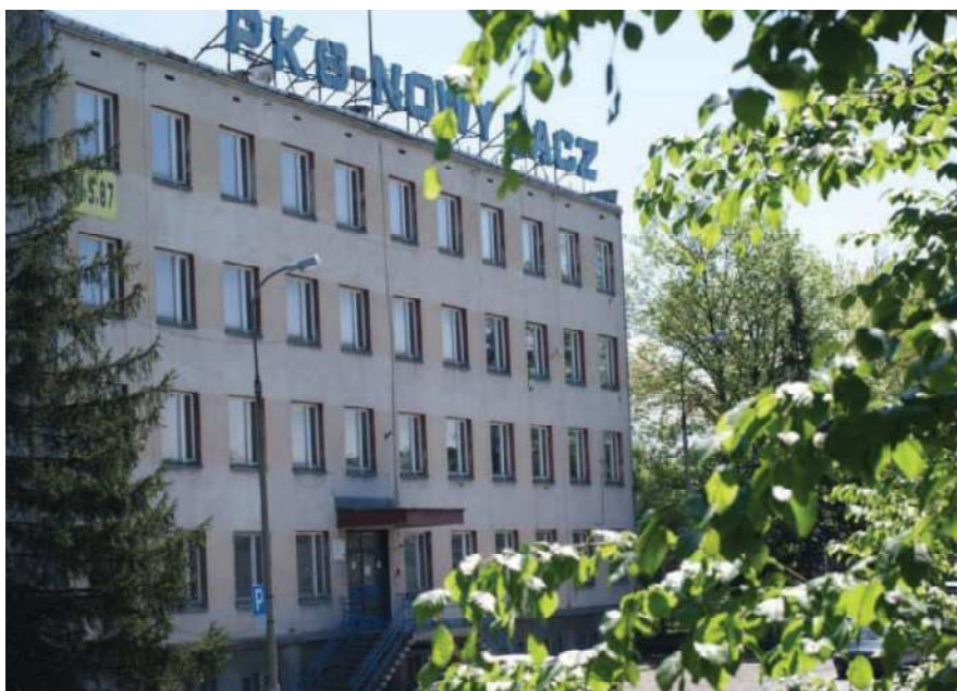
Biurowiec PKS w Nowym Sączu