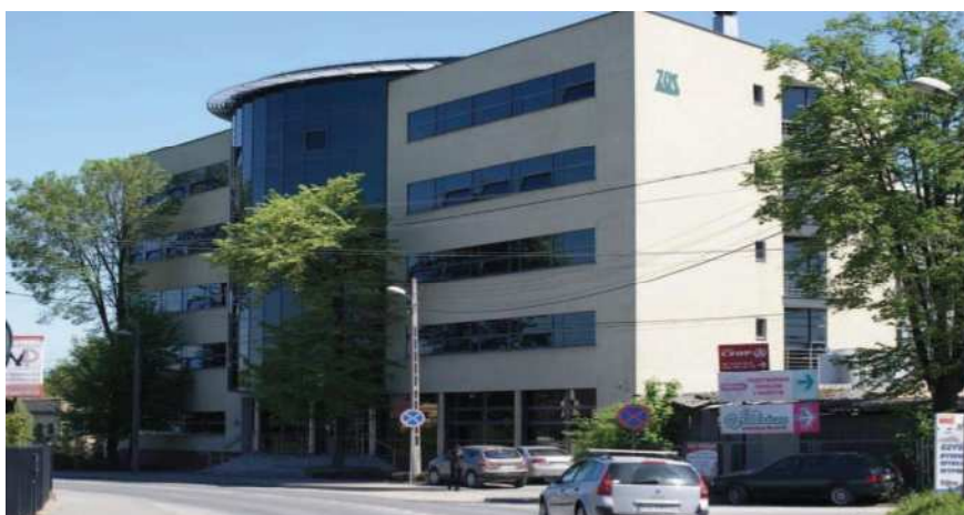
Budynek ZUS ul. Węgierska