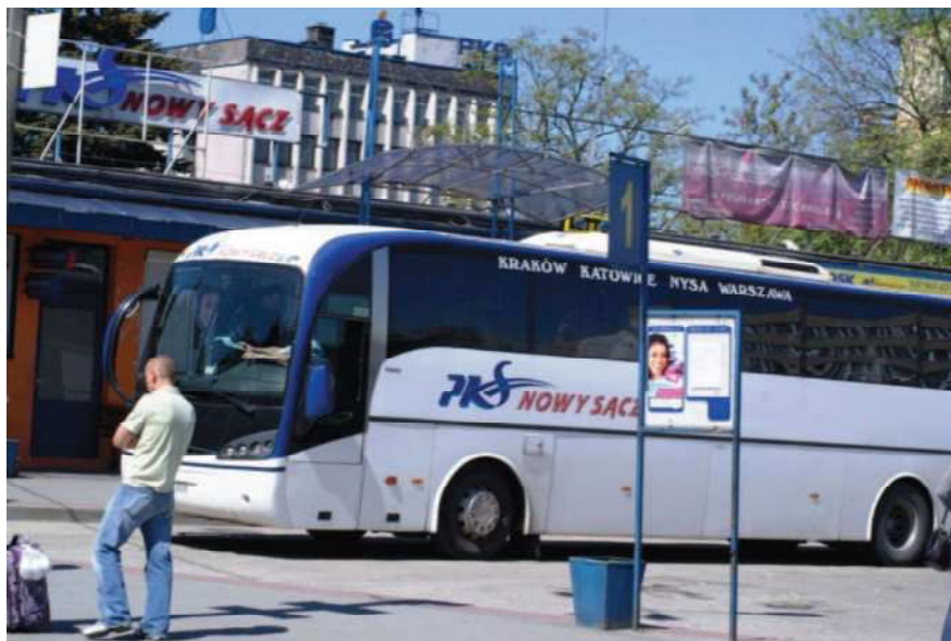
Dworzec autobusowy PKS w Nowym Sączu